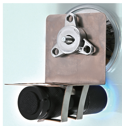
製品内容：ランプ本体・治具・強力吸盤