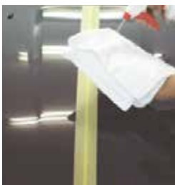
タオルに吹きつけ

(広い面積を一気に塗り込まずに、50cm四方を目安に塗り込みと拭き取りを繰り返して全体を仕上げして下さい。)